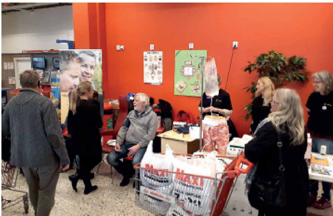
På Världsnjurdagen deltog flera regionföreningar i satsningen med blodtryckstest, däribland Sydsverige.

Njurförbundets ordförande uppmärksammade också de ojämlika väntetiderna i en debattartikel som publicerades i Dagens Medicin den 3 mars 2017, med en uppmaning till folkhälsoministern att uppmärksamma hur den nationella fördelningen av njurar från avlidna donatorer ska ske enligt principen om jämlik vård.